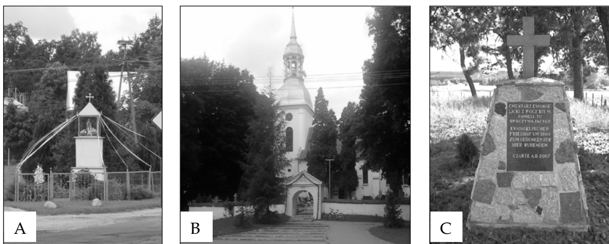
Fot. 1. Przykłady miejsc i obiektów związanych ze sferą sacrum w gminie Dąbrowa Chełmińska: A – kapliczka przydrożna w Gzinie, B – kościół p.w. św. Mikołaja w Ostromecku, C – pozostałości cmentarza ewangelickiego w Czarzu.

Takimi elementami są również, a może przede wszystkim świątynie stanowiące „idealną sferę sacrum ” (Jędrzejczyk, 2004). Jak już wspomniano, na terenie gminy znajdują się cztery takie obiekty, w miejscowościach: Boluminek, Czarze, Dąbrowa Chełmińska i Ostromecko (fot. 1B). Najstarszymi istniejącymi świątyniami są: gotyckie kościoły: p.w. Narodzenia Najświętszej Marii Panny w Czarzu oraz p.w. św. Mikołaja w Ostromecku, pochodzące z XIV w. oraz kościół w Boluminku pochodzący z II połowy XVII w. Najmłodszym obiektem jest kościół w Dąbrowie Chełmińskiej, który został wybudowany na przełomie XIX i XX w. przez wspólnotę protestancką. Po wyemigrowaniu Niemców z terenu gminy świątynia została przejęta przez katolików i nadal pełni funkcje sakralne. Utrzymanie ciągłości w praktykowaniu wiary w tym miejscu, może świadczyć o głębokim szacunku wobec miejsc o charakterze religijnym, niezależnie od wyznania.